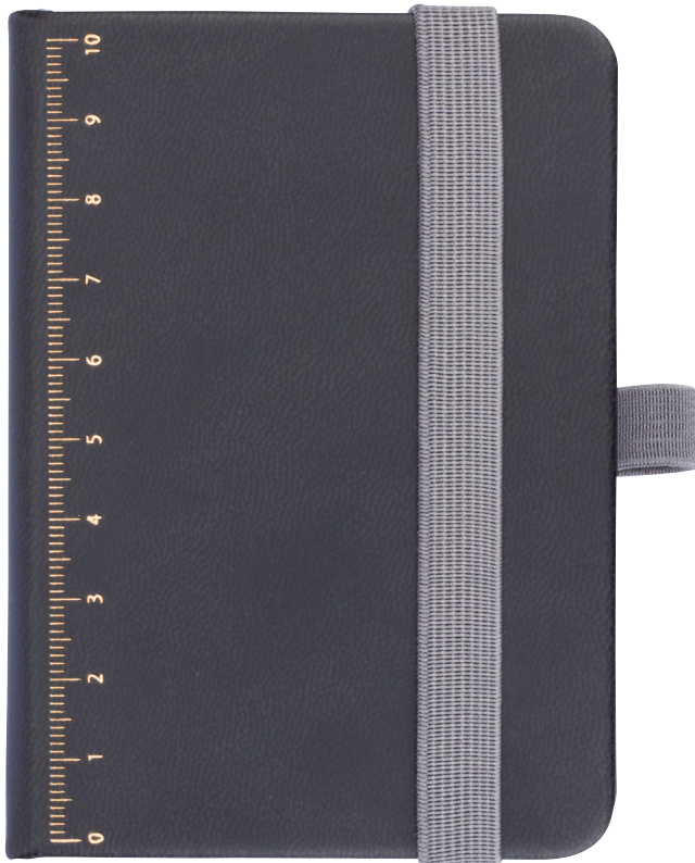
Abbildung oben 1:1

Notizblock DIN A7 inkl. Kugelschreiber, Elastikband-Verschluss, Stiftschleife, Lesezeichen, geprägtes Lineal (10 cm) auf Cover, FSC zertifiziertes Papier, 64 perforierte Blätter (128 Seiten), Punktraster, Fach für Belege, Multitasking-Kugelschreiber CONSTRUCTION LILIPUT (klein), schwarze Mine, Kunstleder, Metall, matt, goldfarben/schwarz