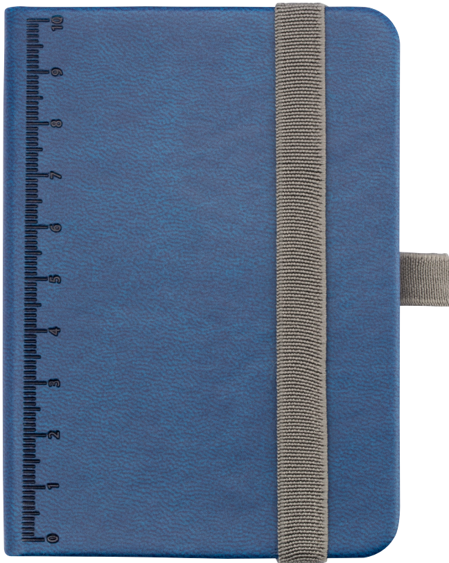
Abbildung oben 1:1

Notizblock DIN A7 inkl. Kugelschreiber, Elastikband-Verschluss, Stiftschleufe, Lesezeichen, geprägtes Lineal (10 cm) auf Cover, FSC zertifiziertes Papier, 64 perforierte Blätter (128 Seiten), Punktraster, Fach für Belege, Multitasking-Kugelschreiber CONSTRUCTION LILIPUT (klein), schwarze Mine, Kunstleder, Metall, matt, dunkelblau