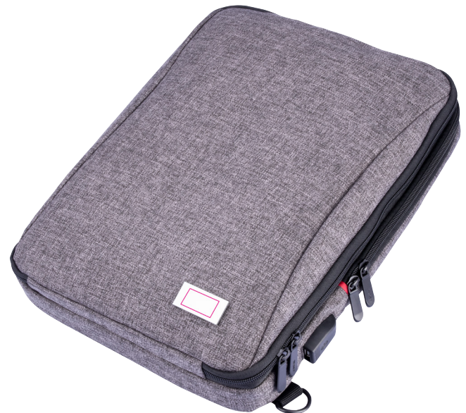
Abbildung oben 1:1

Business-Rucksack zum Laden von elektronischen Geräten, 1 Fach für Dokumente, Laptop, Tablet (bis zu 13"), 1 Elastikbandfach für Zubehör (Every Day Carry), 1 Fach auf der Rückseite, verstaubare, gepolsterte Schultergurte, elastische Schlaufe zur Befestigung am Trolley, integriertes USB-Kabel, Input + Output, Polyester, anthrazit/schwarz