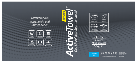
Ansicht der fertigen Banderole