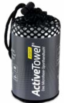
Ansicht im Netzbeutel

— = Druckfläche 231 x 106 mm inkl. 3 mm Beschnittzugabe