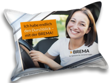
Ansicht des fertigen CarKoser®

• Wir empfehlen diese Angabe aufgrund der Textilkennzeichnungsverordnung.