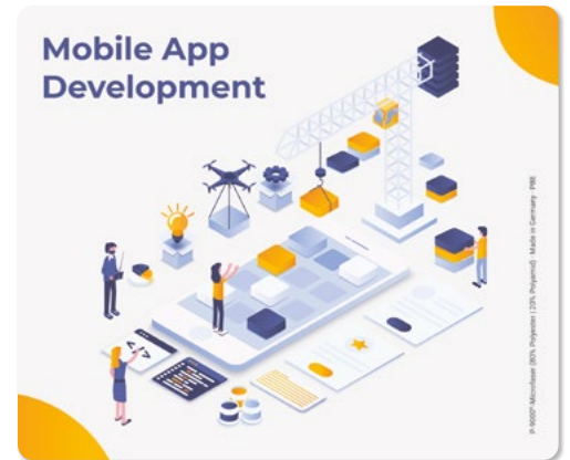
Ansicht des fertigen Displaytuchs