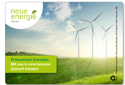
Ansicht des fertigen GripCleaner®