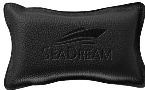
Ansicht des fertigen HFX ® -Displayschwamm