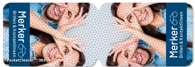
Ansicht des fertigen PocketCleaner® mit Simulation der Antirutsch-Beschichtung